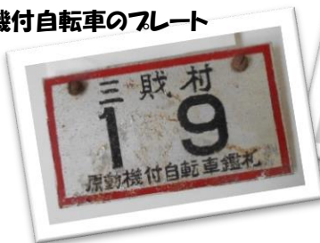
原動機付自転車のプレート

11 月 17 日(土)～12 月 2 日(日) 西都市市制の歴史や図書館 30 年のあゆみを、公文書や貴重な資料等の展示で紹介します。